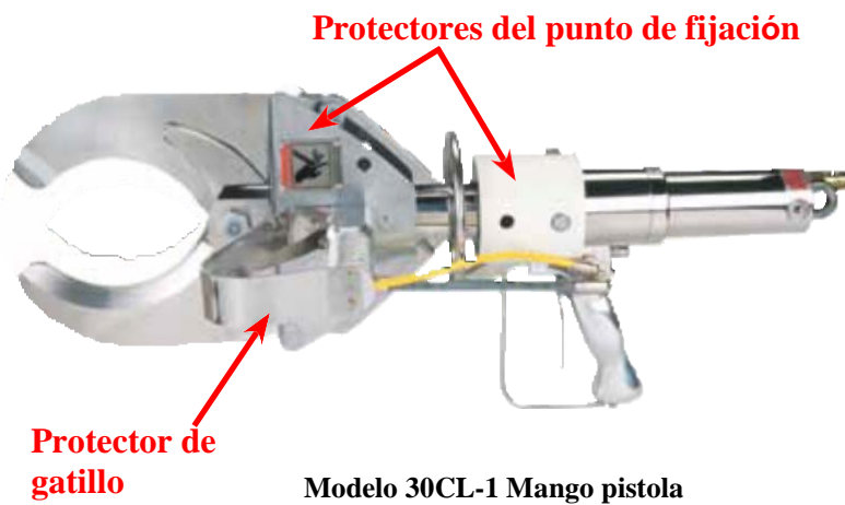
Modelo 30CL-1 Mango pistola