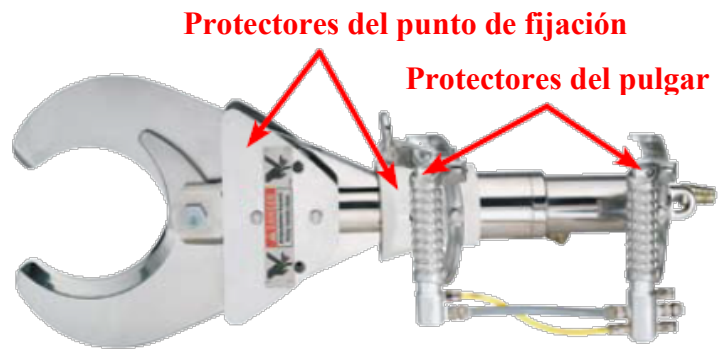
Modelo 30CL-2 Mangos "D"

Cortador neumático/hidráulico Jarvis modelo 30CL-2 para corvejón delantero y trasero y cuernos de vacuno.