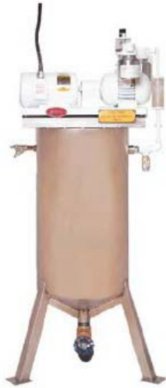
Sistema de aspiración