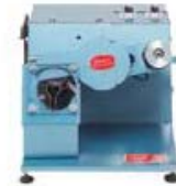
Afilador de cuchillas